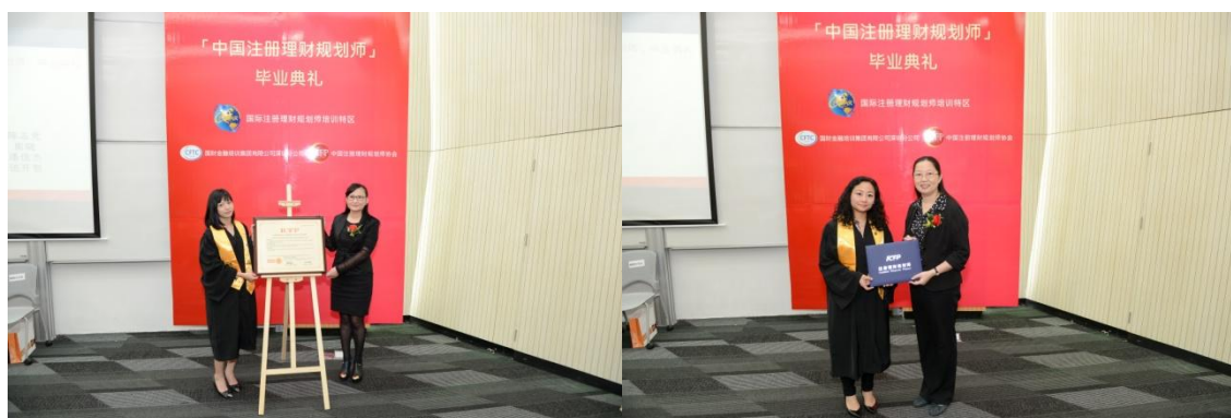
由深圳区各嘉宾颁发证书予国际注册理财规划师毕业生及注册理财规划师毕业生